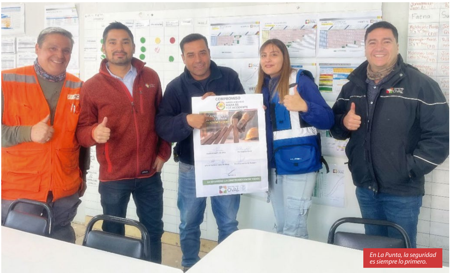
En La Punta, la seguridad es siempre lo primero.

La nueva campaña de seguridad “Nada es por Accidente” plantea un reforzamiento del autocuidado y el cuidado colectivo. Queremos generar conciencia sobre los riesgos presentes en la construcción con un mensaje clave, orientado a que la prevención de accidentes es una responsabilidad compartida. Por eso, a través de charlas integrales, actividades participativas, pausas preventivas, recorridos en terreno y acciones de liderazgo visible, esperamos empoderar a cada trabajador para avanzar en seguridad. Planteamos detener acciones inseguras, reportar oportunamente y actuar de manera preventiva.