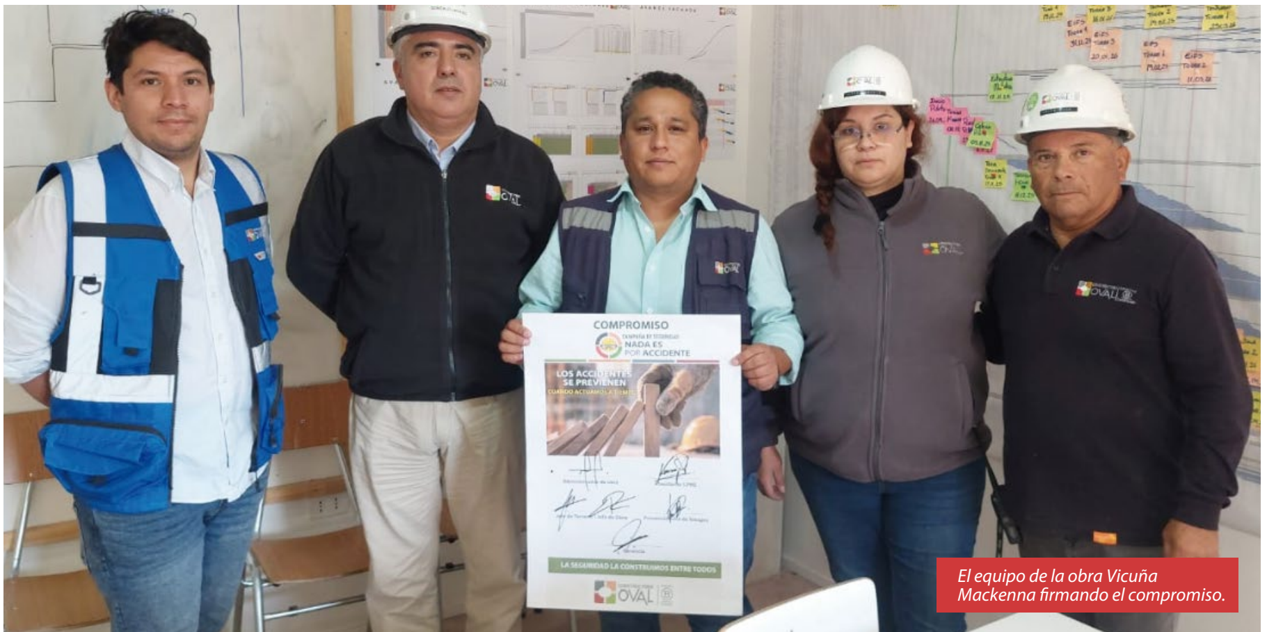
El equipo de la obra Vicuña Mackenna firmando el compromiso.