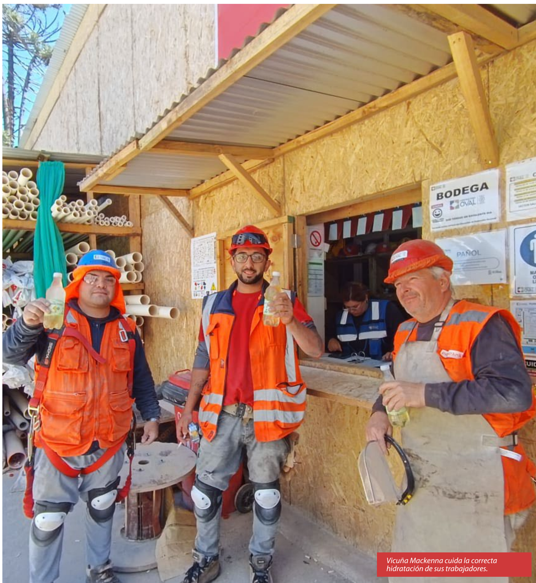
Vicuña Mackenna cuida la correcta hidratación de sus trabajadores.

Con estas acciones, OVAL vuelve a poner en el centro el bienestar de sus equipos en terreno, como pilar del fortalecimiento de espacios de trabajo saludables y seguros