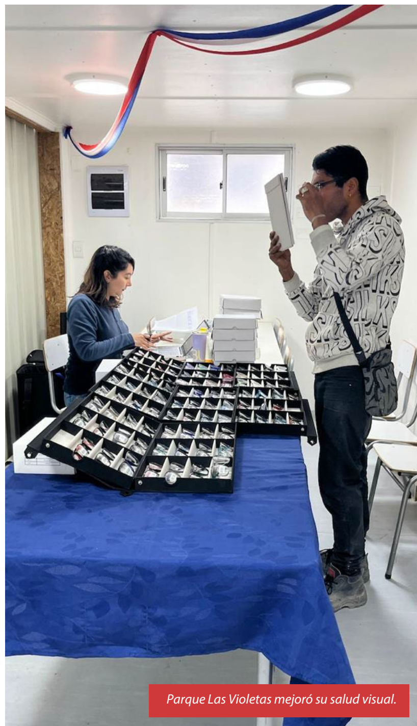
Parque Las Violetas mejoró su salud visual.

De esta forma, el balance fue muy positivo para un conjunto de actividades que se convierte en un claro ejemplo de la importancia que le otorga la empresa a la promoción de la salud y la prevención, reforzando así su cultura de cuidado y respeto hacia las personas.