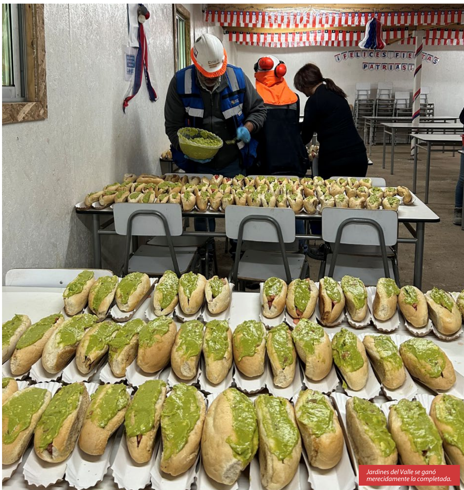
Jardines del Valle se ganó merecidamente la completada.

Este tipo de iniciativas busca fortalecer la cultura preventiva y promover hábitos seguros en todas las obras, con el objetivo de reconocer a quienes hacen de la seguridad un valor presente en cada acción.